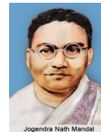
Jogendra Nath Mandal